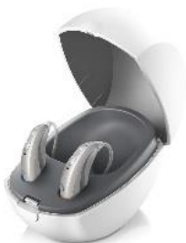
Ecrin de charge